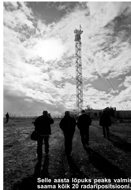
Selle aasta lõpuks peaks valmis saama kõik 20 radaripositsiooni.

Selle aasta lõpuks peaksid ehituslikult valmima kõik 20 radaripositsiooni. Radarite paigaldamine, nende integreerimine ühtsesse süsteemi jääb 2004-2005 aastasse.