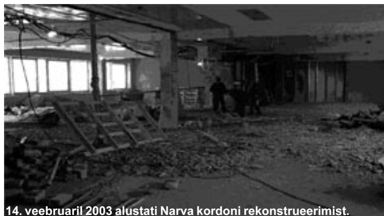
14. veebruaril 2003 alustati Narva kordoni rekonstrueerimist.

tati 30 m kõrgune radarvaatluse torn asukohaga Narva linn Kulgu sadam ja asub maa-alal pindalaga 100 m 2 .