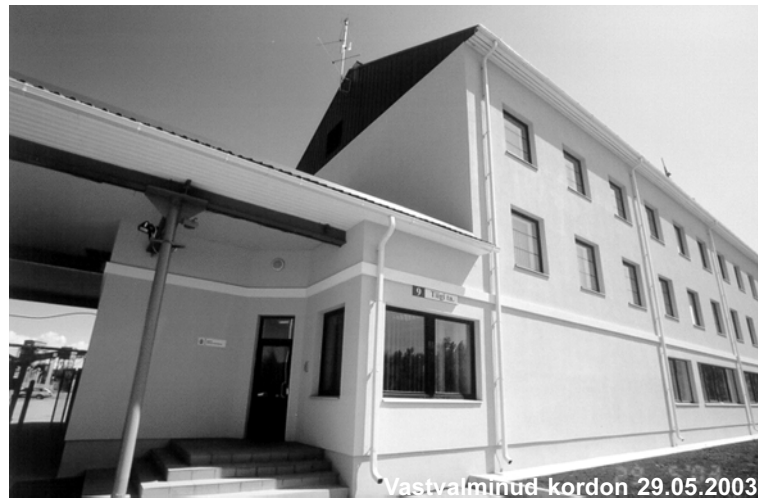
Vastvalminud kordon 29.05.2003