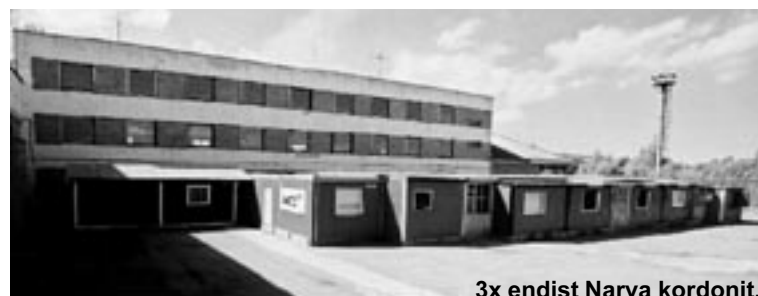
3x endist Narva kordonit.