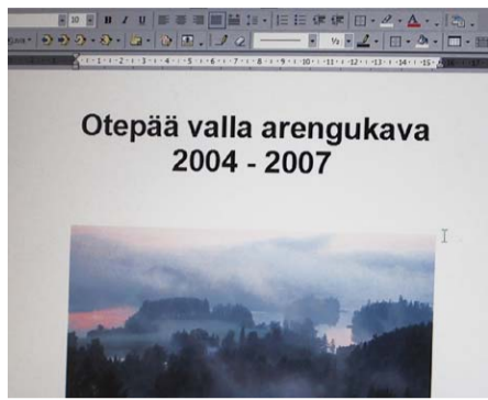
Arengukavaga saab tutvuda alates 29. märtsist valla kodulehel: www.otepaa.ee