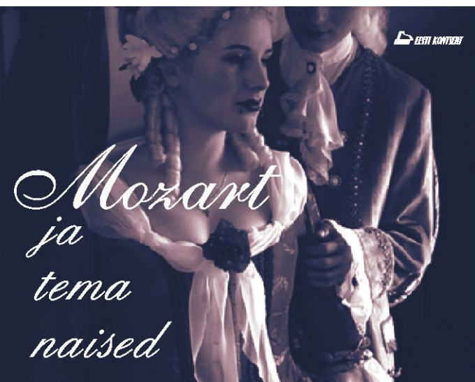
Teisipäeval, 23. märts 2004 kell 18 Jõgeva Muusikakoolis Pääse: 15 ja 25 krooni

www.virtus.ee info@virtus.ee tel 772 1922.