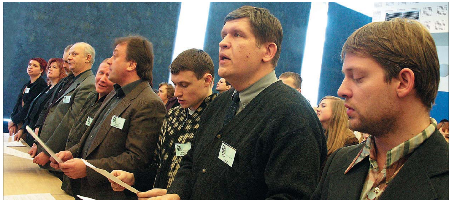
Žüriil ehk Suurel Kõrval tuli kahe päeva jooksul ära kuulata enam kui 60 ansambli esinemine.