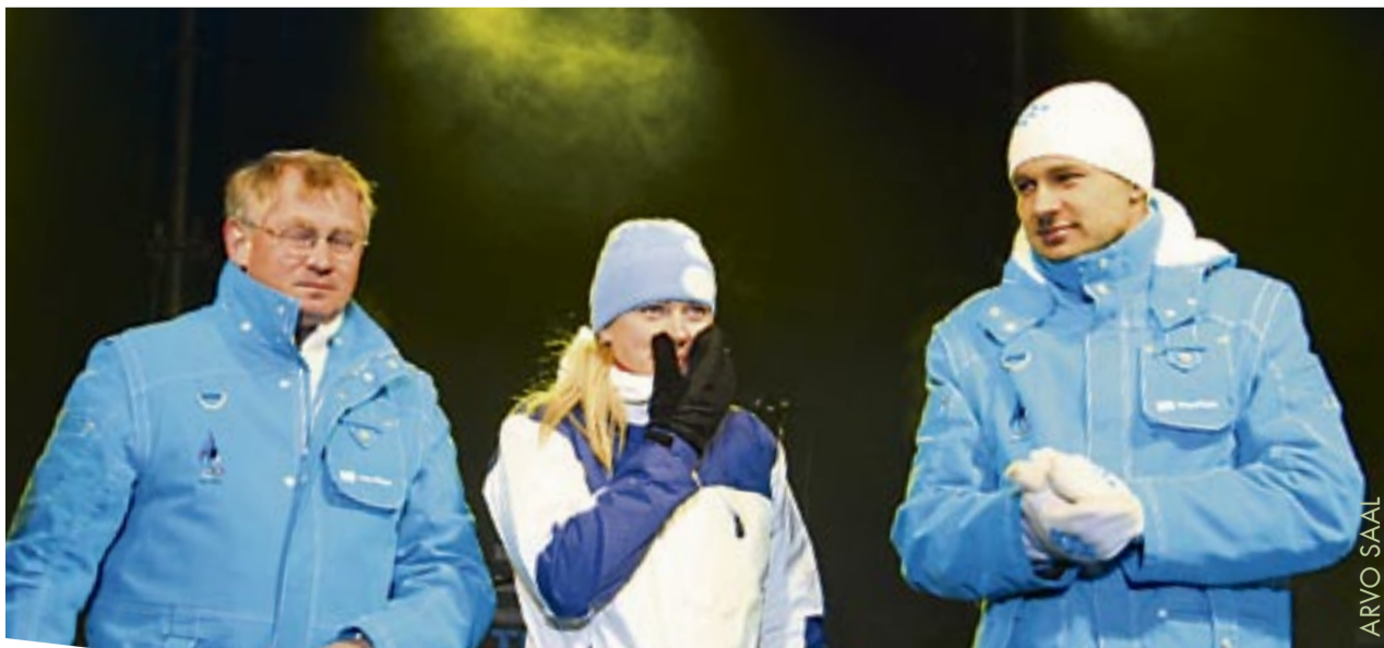
Anatoli Šmigun, Kristina Šmigun ja Andrus Veerpalu on tervitava rahva ees kesklinna püstitatud laval.