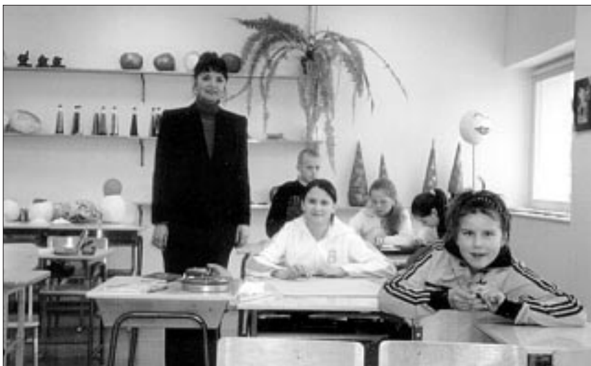
● 16. märtsil toimus kaunite kunstide nädala joonistamisvõistlus.