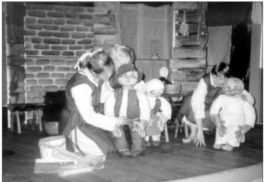
● Mängib Räpina Rahvakooli Nukuteater.