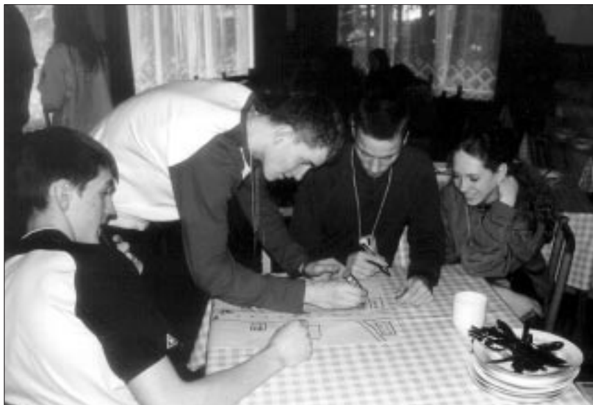
● Viiratsi Lastekodu noored visandavad grupitöös linna kaarti.

jad tutvustasid vangla keskkonda ja igapäevaelu. Pärast mitmetunnist vnglas viibimist olime igatahes oma noortega rõõmsad, kui avati peavärav ehk tee uuesti meie maailma.