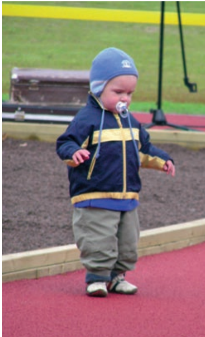
Vastavatud linnastaadion on heaks stardiplatvormiks kõigile tulevastele Erki Nooltele ja Gerd Kantritele. Üks tulevikutegijast juba uudistas uut staadioni avamispäeval õige tähelepanelikult.

Sihtasutuse rahastamise võtab enda kanda Jõgeva Linnavalitsus. Kindlasti jätkatakse ka teiste spordiorganisatsioonide rahalist toetamist. „Toetuste jagamisel eelistame noortesportdiga tegelevaid ühendusi ja klubisid, sest nende töö ta-