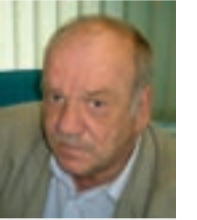
AARE OLGO Abilinnapea

Parandamist vajavaid tänavaid jätkub mitmeks järgmiseks aastaks. Kui palju me mingil aastal teha saame, sõltub linnavolikogus tehtud valikutest.