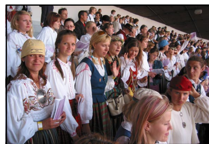
Tabasalu Kammerkoori sopranid laval laulujärge ootamas