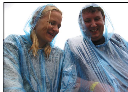
Vaprad laulupeolised vihmale alla ei andnud