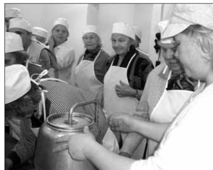
Eakad tegid piimandusmuuseumis oma kättega võid.

alles elamus ja tagasisattumine lapsepõlve. Tegime ise võid ja pärast söime seda musta leivaga. Küll oli hää! Uudistasime ka ligidal olevat Imavere kõrtsi.