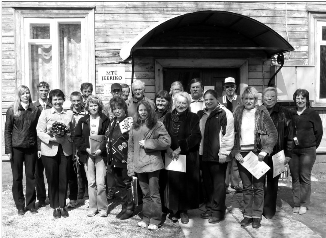
MTÜ Jeeriko ees tehtud pildil on Tapa piirkonna töötud, kes läbisid Euroopa Sotsiaalfondi kaasrahastatud projekti nr I.03.01-01.09 raames toimetuleku- ja kohanemiskoolituse Tapa linnas ajavahemikus 21. märtsist kuni 27. aprillini. Koolitusel tutvuti tööturu olukorra ja võimalustega, tööõiguse ja sotsiaalsete garantiidega, psühholoogilise eneseapositsioneerimisega, enese esitlemise ja käitumisega tööintervjuul, arvutiksutamise ABCga.