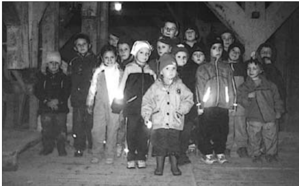
Pühajärve lasteaias käisid Hellenurme vesiveskis ja said teada, kuidas valmistada jahu ja manna.

Lasteaed alustas koos lühikesa uue lapsega täie hooga tööd jälle septembris. Kuu alguses läksime matkama, sihtpunktiks oli Väike-Trommi turismitalu. Tore oli, et uued lapsed said kollektiiviga tuttavaks just matkateel. Jalutades vaatlesime loodust: puid, seeni, loomakesi. Turismitalus mängisime, võistlesime, söime lõunasööki ning kiikusime suurel kiigel.