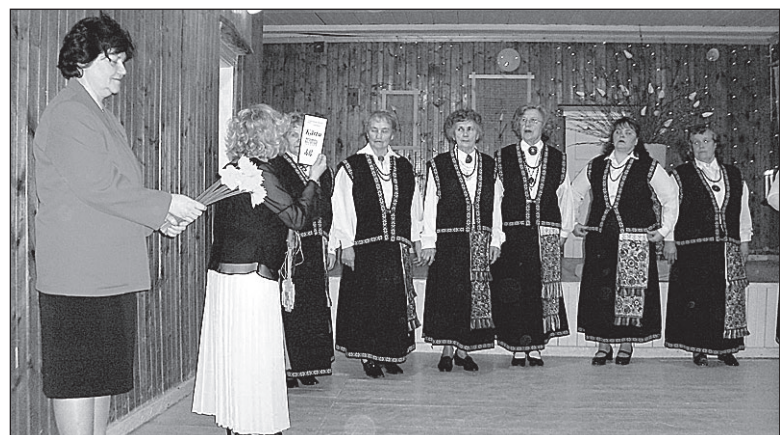
• Tantsurühm „Kärtu“ oma 10. aastapäeval.