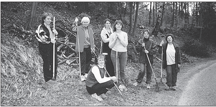
• Tantsurühm "Mari" eelmise aasta aprillis heakorrapäeval.