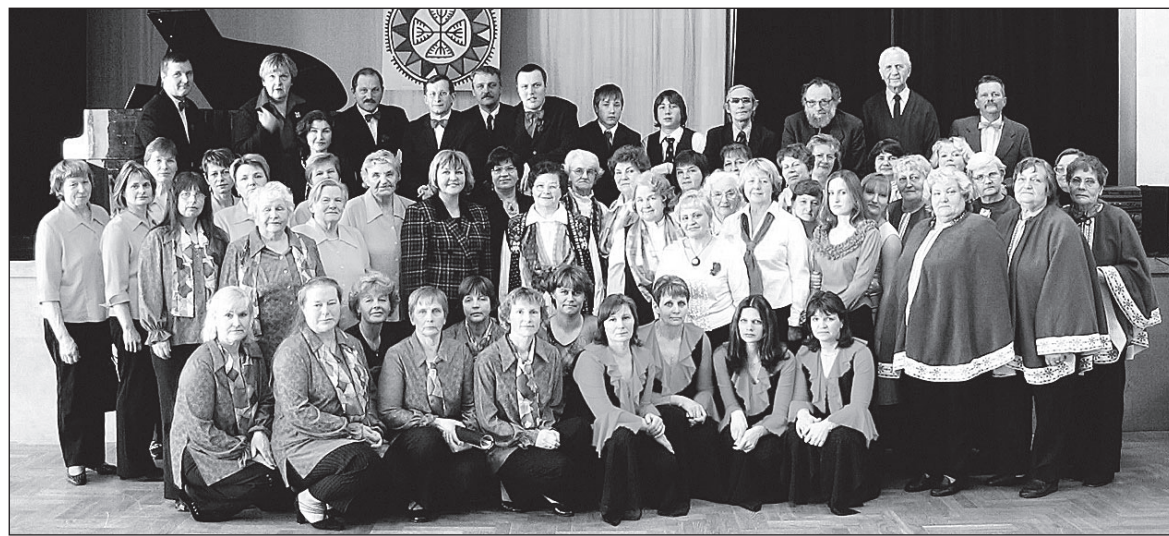
• Karksi ja Salme valla koorid kultuurikeskuses.