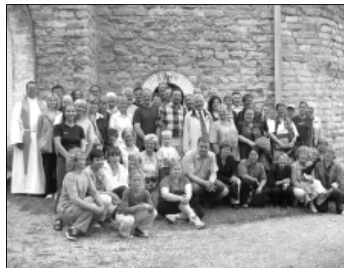
26. juulist kuni 2. augustini külastas Eestimaad Lehtse kammerkoori partnerkoor "Siegburger Madrigalchor" Saksamaalt (Tapa tegid koorid ühispidi). Koos ja eraldi anti mitmeid kontserte, üks viimastest hiljuti Järveldal lõppenud Eesti Talupeavadele. 1. augustil Tapa Jakobi kirikus toimus jumalateenistusel esitas koor kokku kuus laulu