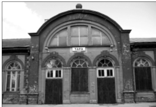
Tapa endine kaunis jaamahoone meenutab laudadega kinni löödud uste ja akendega tondilossi

Kui külaline takso ootamisest tüdineb, siis seab ta sammud bussijaama poole. Aga kumma? Jah, neid on meil lausa kaks – üks "vä-