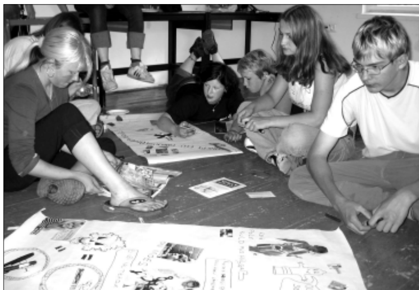
Kooli tänav 24 asuvas Tapa laste- ja noortekeskuses kujundasid projektist osavõtjad hoiatusplakateid

Järgmisel päeval külastasime kogu pere lõbustusparki Vembu-