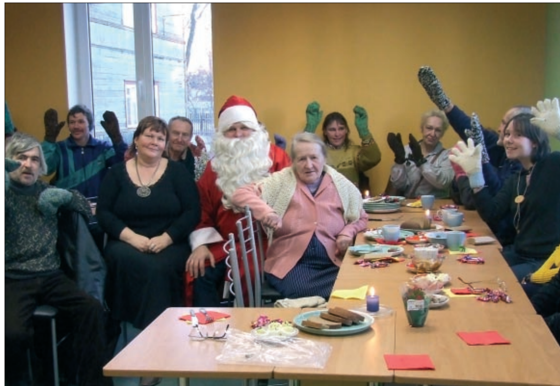
Ilusaid jõulupühi ja parimat uut aastat soovib jõuluvana koos Jeeriko-rahvaga.