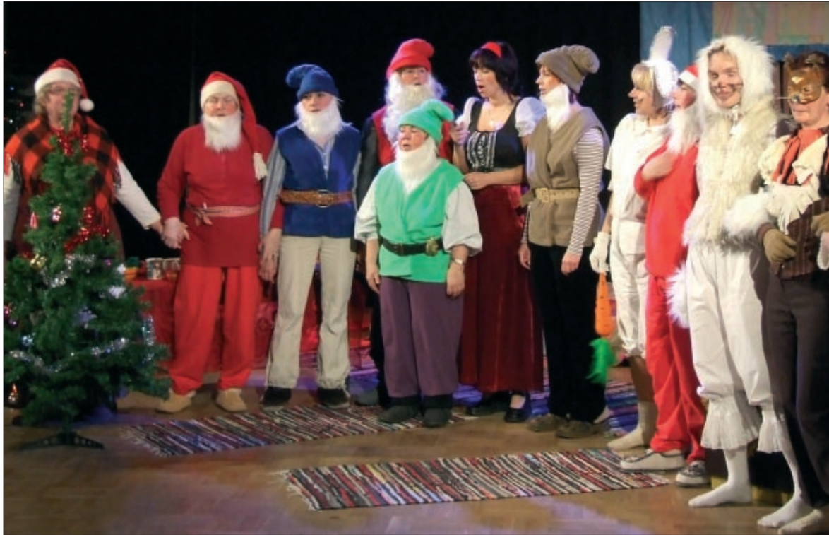
Lumivalgeke koos saatjatega kultuurikoja laval.