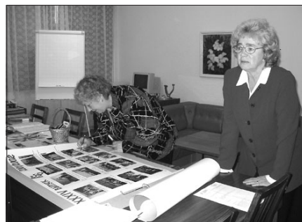
• Mullu novembris valmistusid slaavi gümnaasiumi õpetajad tähistama kooli 35. aastapäeva. Suurim oli kool 1987. aastal, kui õpilaste arv ulatus 477-ni.

Mõni lapsevanem on probleemi lahendanud nii, et lapsed õpivad eesti koolis. Uuringud teemal „Vene lapsed eesti koolis“ alles käivad ja kokkuvõtteid pole tehtud. See võtab aega vähemalt kümme aastat. Me ei tea, kuidas tunnevad ennast need lapsed. Kelleks nad kasvavad? Nendel lastel, kes ei tule toime õppimisega eesti keeles, on täna Paides võimalus saada haridust vene keeles.