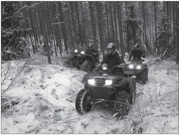
ATV-matk on mõnus atraktiivne ajaviide motosporti- ja loodus-huvilisele inimesele, mida saab harrastada iga ilmaga.