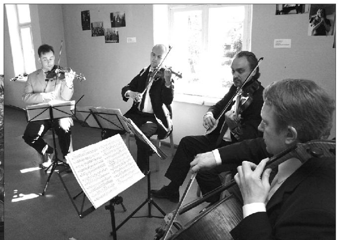
Tobiase nimeline kvartett Kapi Ühingu majas