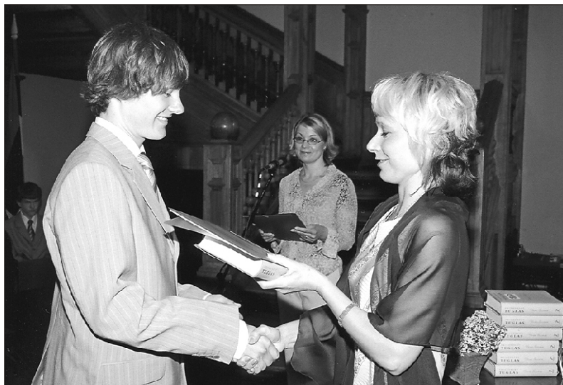
Lõpuaktus Olustvere Põhikoolis