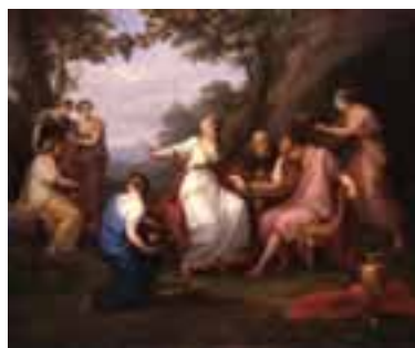
Leinav Telemachos mentoriga Kalypso saarel. 1788. Õli lõuendil. Bündner Kunstmuseum Chur.