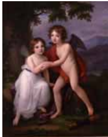
Lord Plymouthi lapsed Amori ja Psychena. 1795. Õli lõuendil. Bündner Kunstmuseum Chur.

Samas jäi valgustuslik naiseideaal ikka tütarlapselikult tagasihoidlikuks, õrn-tundlikuks ja vooruslikuks nagu Väliskunsti Muuseumile kuuluva maalipaari (1780. aastad) peategelane. Süütuse sümbolit, valget kleiti, kandev Ilu, kes autori antud pealkirjadest lähtuvalt