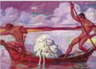
August Jansen. Luigejaht. 1915–1916. Õli lõuendil.