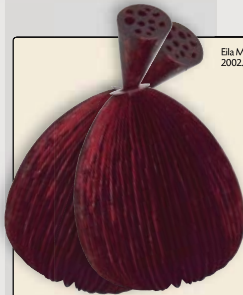
Eila Minkkinen. Lootos. 2002. Vask. Repro.