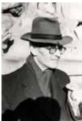
Wiiralt Pariisis. Märts 1951.