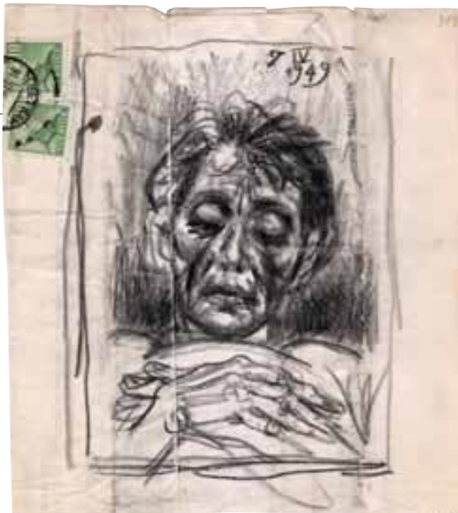
Eskiis gravüürile "Haige poeet". 1949. Pliats.