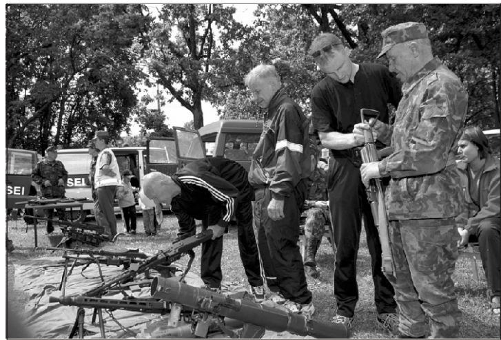
Olgu mees väike või suur, relvade juures on tal ikka midagi uurida ja uudistada.

kaitsepäev aga Suure-Jaanis. Masinate, relvade jm huvilisi ja uudistajaid jätkus siingi, kuigi eelinformatsioon toimuva kohta oli üsna napp ja pisut hilinenud. Õigeaegse ja piisava teavitamise korral oleks uudistajaid kindlasti rohkem kogunenud.