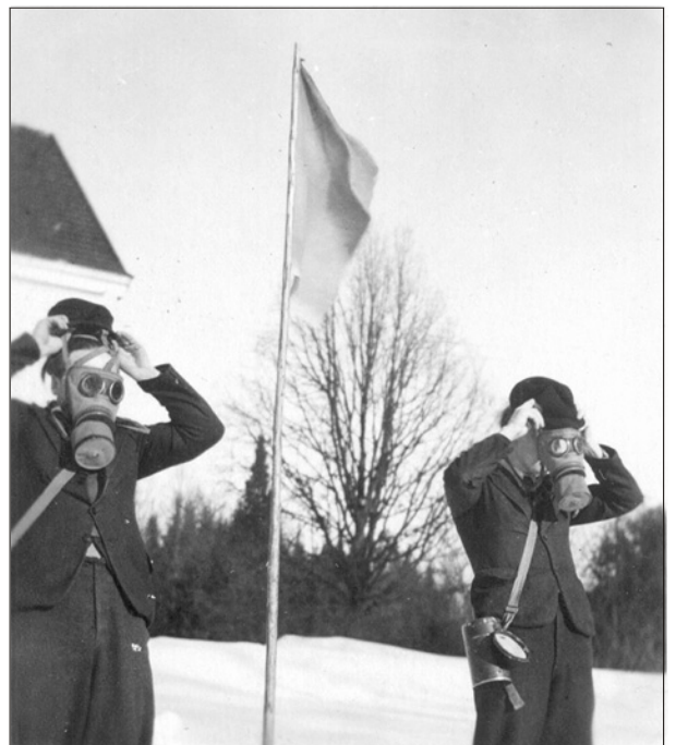
Poisid gaasikaitse õppusel