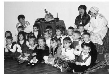
Olustvere lasteaia jõulupidu toimus rahvuslikus meeleolus