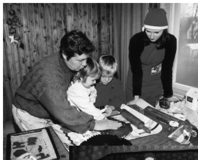
Suure-Jaani päkapikud on ametis piparkoogiküpsetamisega