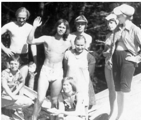
Libaajakirjanikud pilpalossi katusel