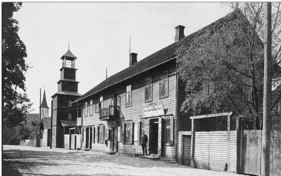
Suure-Jaani kultuurimaja (esiplaanil) 1930. aastatel