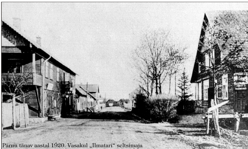
Pärnu tänav aastal 1920. Vasakul „Ilmatari“ seltsimaja