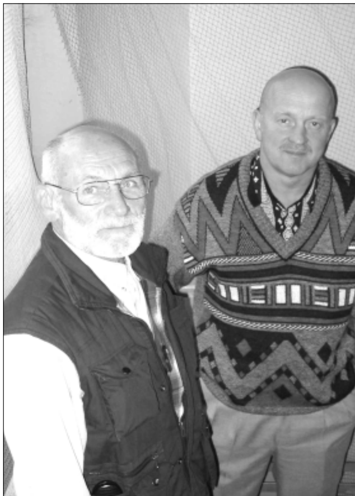
■ Ettekannete vaheaegadel saadi vestelda omavahel

Kalahaigustest- EL-s pole lubatud malahhiitroheline /kantserogeen!/ Kasutamise korral võidakse hävitada