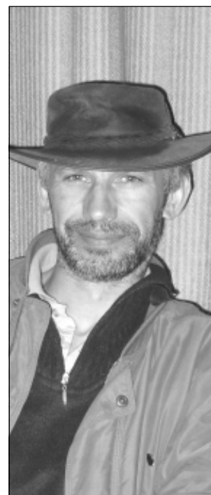
■ „Mul on kalurigeenid, Võrtsjärvest püüdsid kala minu isa ja vanaisa. Olen ka ise kalur olnud“.