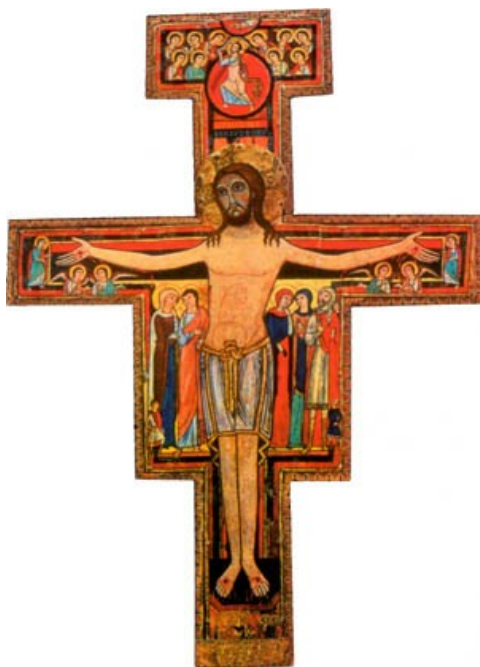
San Damiano rist, Itaalia, X saj.

[Tõlgitud: Wisdom from Mount Athos. The Writings of Staretz Silouan 1866-1938 . Ed. Arcimandrite Sofrony. Tr. By Rosemund Edmonds. New York: Crestwood, pp. 19-23.]