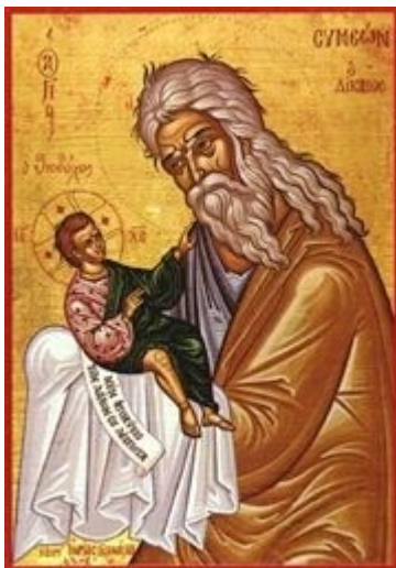
Pühad Siimeon Jumala Vastuvõtja