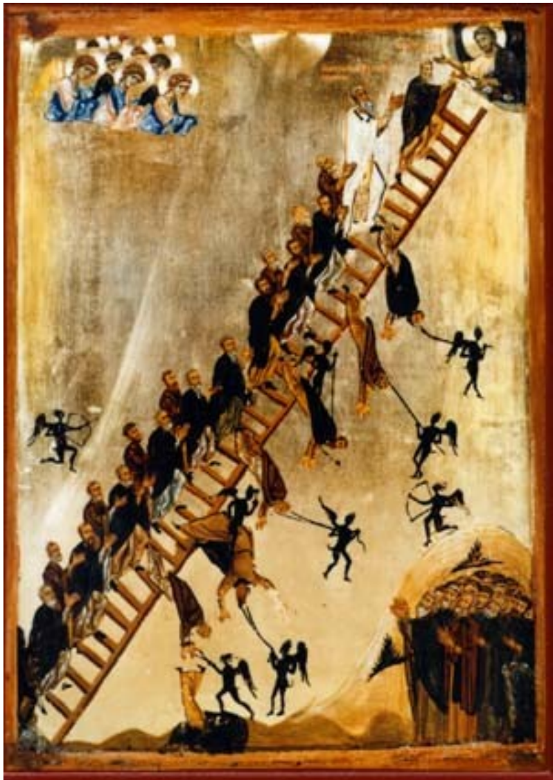
Jumaliku tõusmise redel