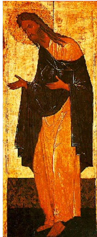
Ristija Johannes Novgorod, u 1475