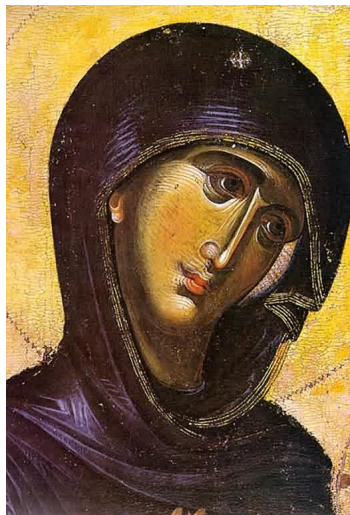
Jumalaema Aatose mägi, XIII saj.