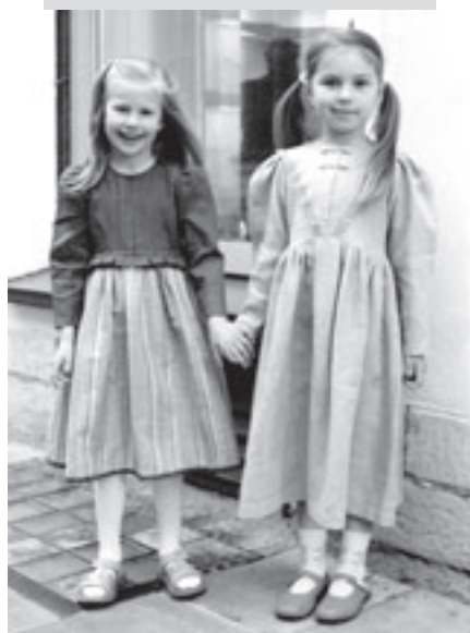
Rahvuslikel ainetel kleidid lastele. Autor Maaja Kalle.

videl täisvillasesest lõngast kootud pruutkleidile.