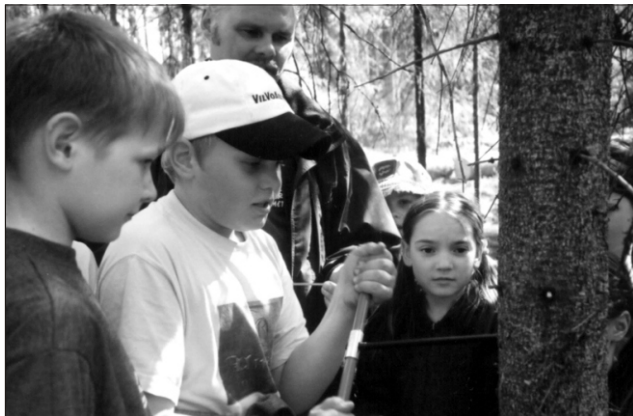
Kui vana see puu siis on ...