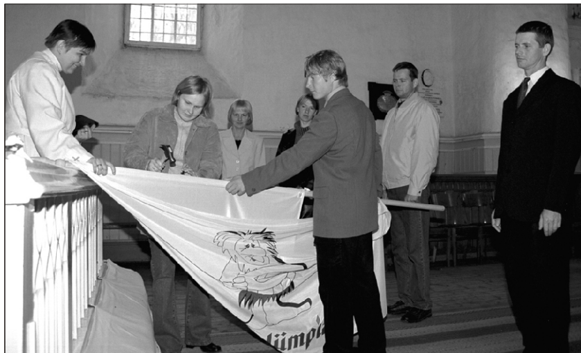
17. mail pühitseti Suure-Jaani kirikus spordiklubi “Vanad Olümpiaalad” lipp.