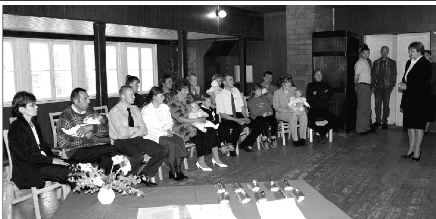
Taas üle paljude aastate korraldas Suure-Jaani vald vastsündinud vallakodanikele piduliku vastuvõtu ja kinkis lastele nimelise lusika.