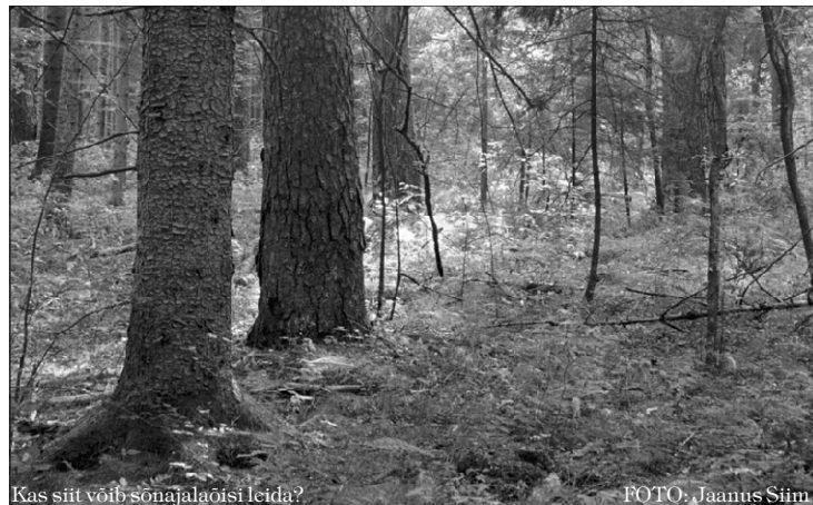
Kas siit võib sõnajalaõisi leida?