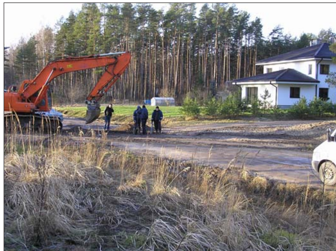
Lisaks veetrassidele käib ka gaasitorustike paigaldamine. Töö käib Raudtee tänaval