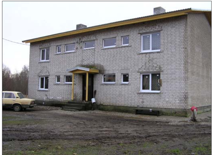
Vallale kuuluv 4 korteriga sotsiaalelamu Põlendmaal sai tänu uuele katusele, akendevahetusele ning korridoride remondile uue väljanägemise.

Kui eelnevatel aastatel olen palunud vallakodanikelt mõistvat suhtumist seoses uute vee- ja kanalisatsiooni trasside rajamisega üleskaevamisest tulenevate probleemide talumisel, siis 2006. aastal läksid just need tööd täismahus lahti ja on õnneks kulgenud ilma suuremate tagasilöökideta. Kokku rajati eelmisel aastal üle 7 km vee- ja 3 km kanalisatsiooni uusi trasse: Jõeakda tee 3 km veeturustiku; Seljametsa tee, Nurga tn, Mäe tn 900 m vee- ja kanalisatsioonitrasse; Põllu