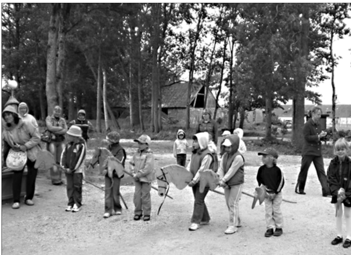
Kilplalas tegid Sinilille lasteaia lapsed kepphobustel võidajamist.