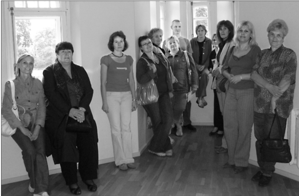
Tapa valla raamatukogutöötajad koos kolleegidega Lääne-Virumaa Keskraamatukogust Jänedas mõisaga tutvumas.