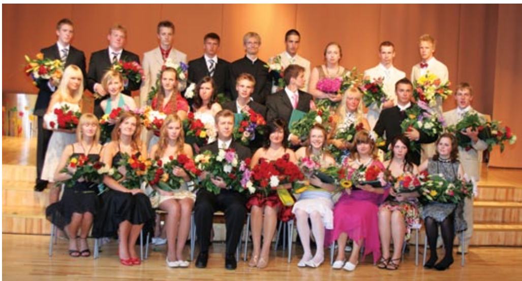
21. juunil astus ellu TÜG 19. lend, klassijuhatajaks Kaider Vardja.