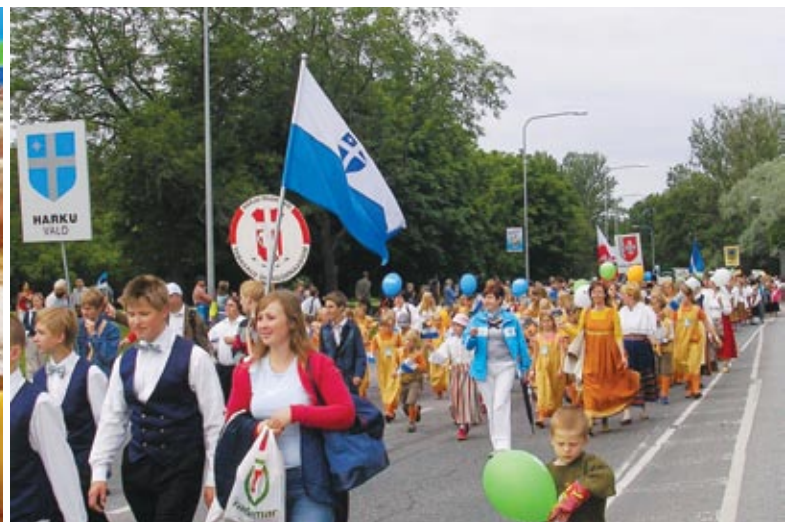
Harku vald oli laulu- ja tantsupeol esindatud viie kollektiiviga.