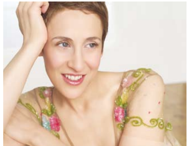
Stacey Kent, BBC poolt 2002. a parimaks jazzvokalistiks tunnustatud lauljatar, astub üles 14. juulil Tabasalu keskväljakul.