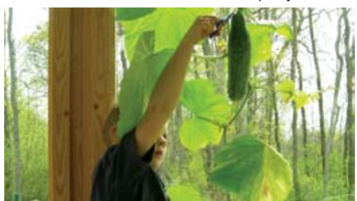
Rannamõisa lasteaias saavad lapsed maast-madalast loodusega sinasõbraks.