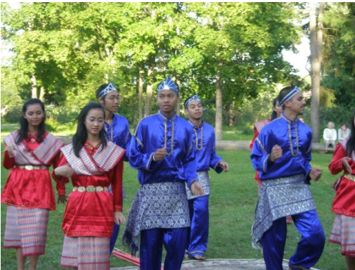
◀▼ Augusti alguses külastasid Juurut rahvusvahelise festivali II Märjamaa Folk raames Indoneesia folkloorirühm ja „Leigarite“ laste folkloorirühm.