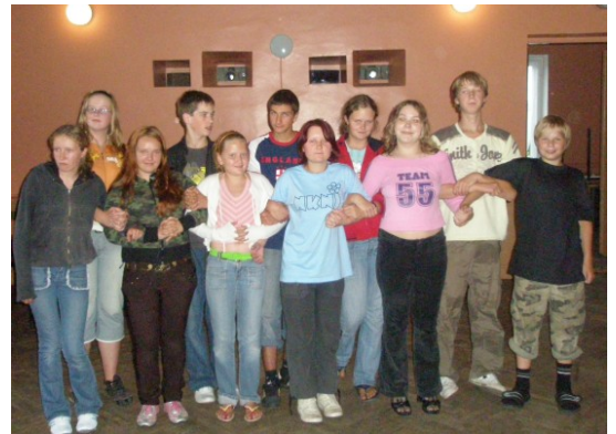
▶ 26. augustil toimus noorteklubi Noored Juured viies meeskonnakooolitus. Kuus noort sai klubi täisliikmeks ja vastu võeti üks uus liige. Pilte noorteklubi tegevusest saab vaadata www.fotoalbum.ee/user/eli4 .