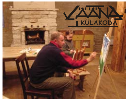
Septembris alustavad Vääna Külakojas taas huvialaringid: kunstiring kogus eelmisel hooajal kiiresti igas vanuses osalejaid.