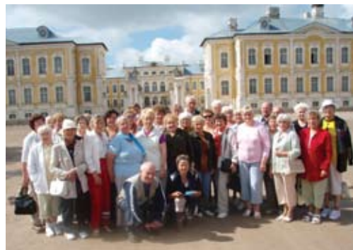
Reisiseltskond Läti Versailles'ks kutsutud Rundale lossi taustal.

Tia Spitsõn, sotsiaalhoolekande osakonna juhataja