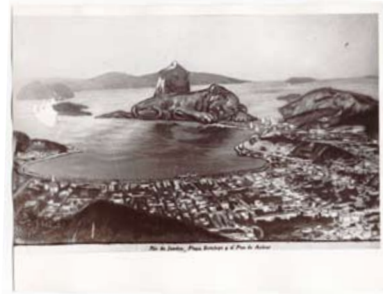
Näitus "Põhi ja kirre" on Kumu 5. korrusel avatud 18. maini 2008.