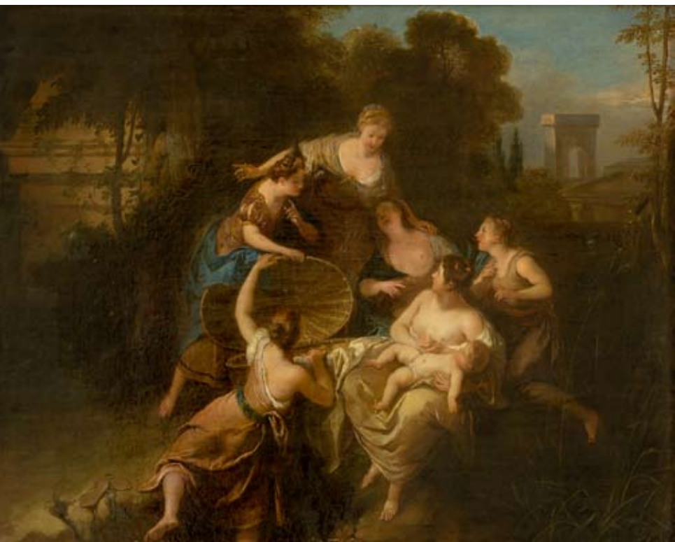
Jean François de Troy. Moosese leidmine. U 1717. EKM