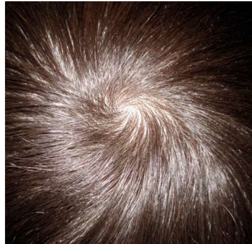
Juri Lissovski. Sürja galaktikad. 2008. Osa seeriast

Näitus "Reis maale. Etnograafilised tüübid fotos" on Kumu III korruse B-tiivas avatud 14. septembrini 2008.