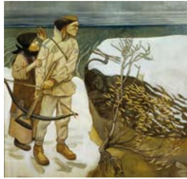
Akseli Gallen-Kallela. Joukahainen kätemaks. 1897. Tempera. Turu Kunstimuuseum