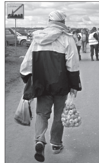
Kala ja sipul jäivä laadu pääl külh pulstõ varjo, a kodo ostõti ütēn iks sibulit ja kalla.