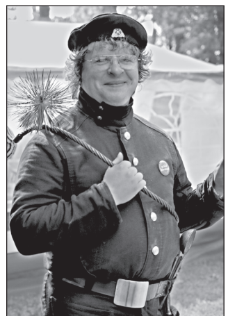
RAHMANI JANI PILT

Ago luut, et lõud vasta talvõ õks mõnõ «peris» tüü. Täl omma celektrigu-paprõ, korsnapühkjä ummi viil ei olõ, a