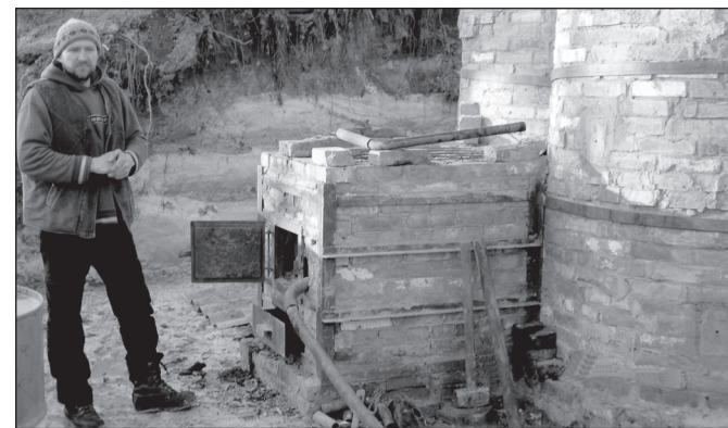
Küllätüvä miis Raali Ain uma tõrvaaho man.

Tõrva nakkas Ain tegemä pedäjäkandõst, miä omma nii 10–20 aastakka maa sech olnu. Üte kütmissõga saa Ain tõrva tetä kõrraga 150 liitrit. A kütma piät tõrvaahjo üttejärke