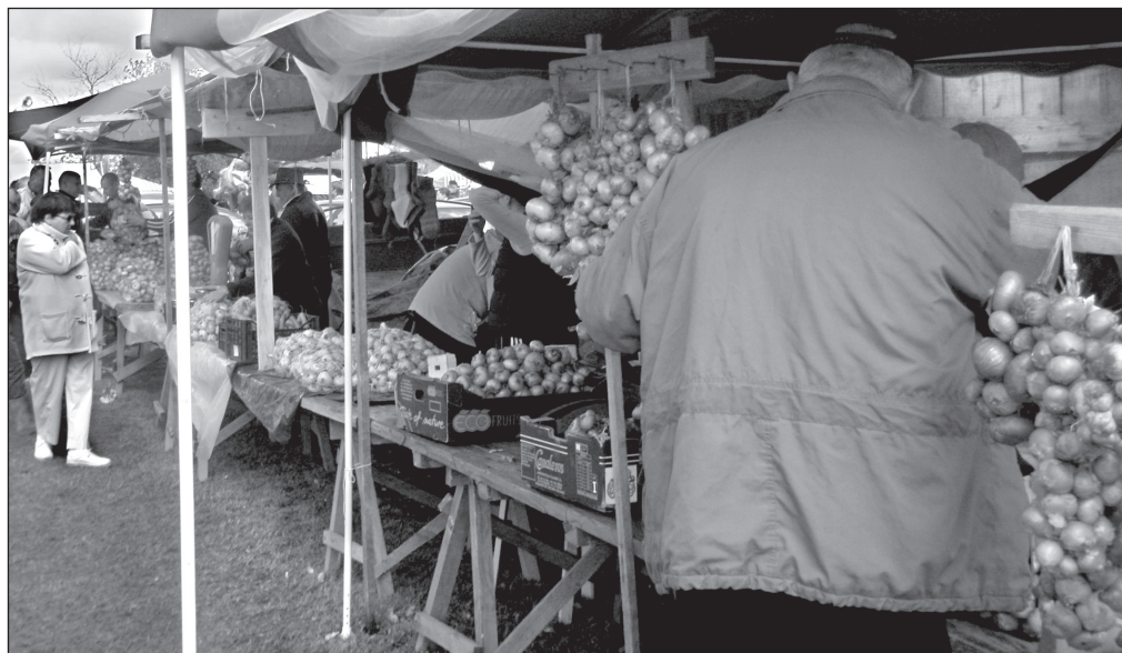
Sipul läts häste kaubas, esierānis verrev sipul.

Kalakilõ massõ laadu pääl mõnõkümne krooni ümbre, sibulakilõst küsüti nii 9–10 kruuni.