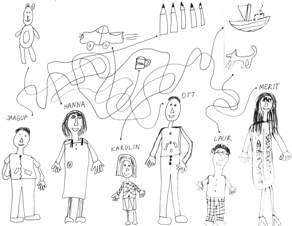
Joonist SAARÕ HIPPI (7)

Seo kõrd kaeq, määne lats midä jouluvana käest kingitõses sai! Vastus saadaq ärq ildambalt 8.01.2009!