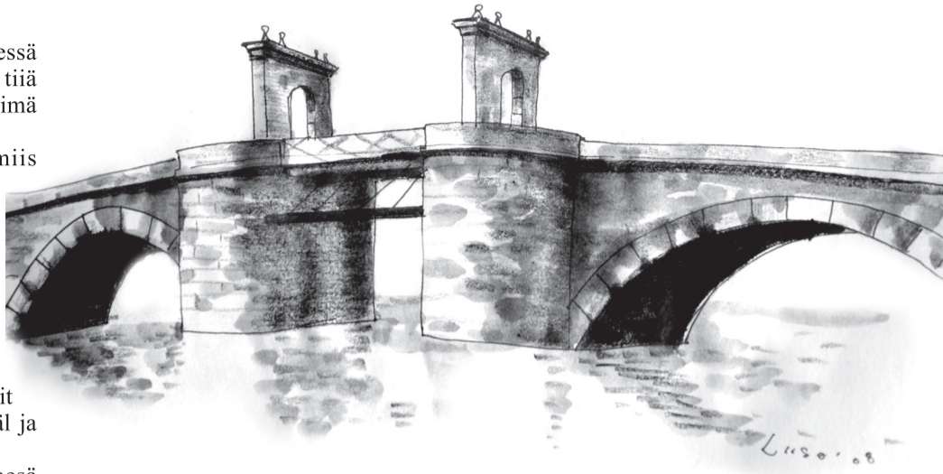
PLATSI LIISO TSEHKENDÜS

Kraam panti vankri pääle, naanõ ja latsõ ütten ja minek! Inemise pagõsiva üle kivisilla. Sild oll joba miine all. Vanaesä võtsõ