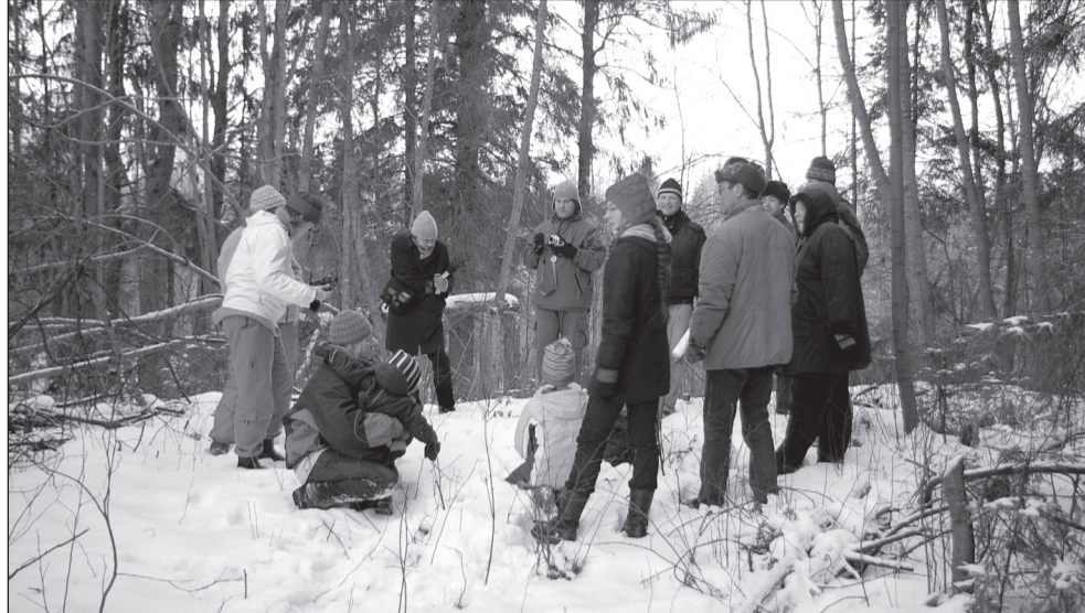
Matka lõpõtus Urvastõ kihlkunnan Kungusõmäe pääl.

Ku olõt harinu maailma suurõmbidõ mäki otsa ronima, sis või autoga üte Võromaa kundikõsõ mant tõeõõs mano