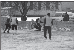
Avati kunstmurukattega jalgpalliväljak lk 6