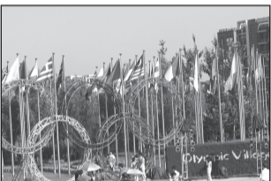
Äraarvamatu Hiina V lk 5