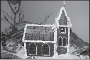
Muuseumis näeb maitsvaid maju lk 3