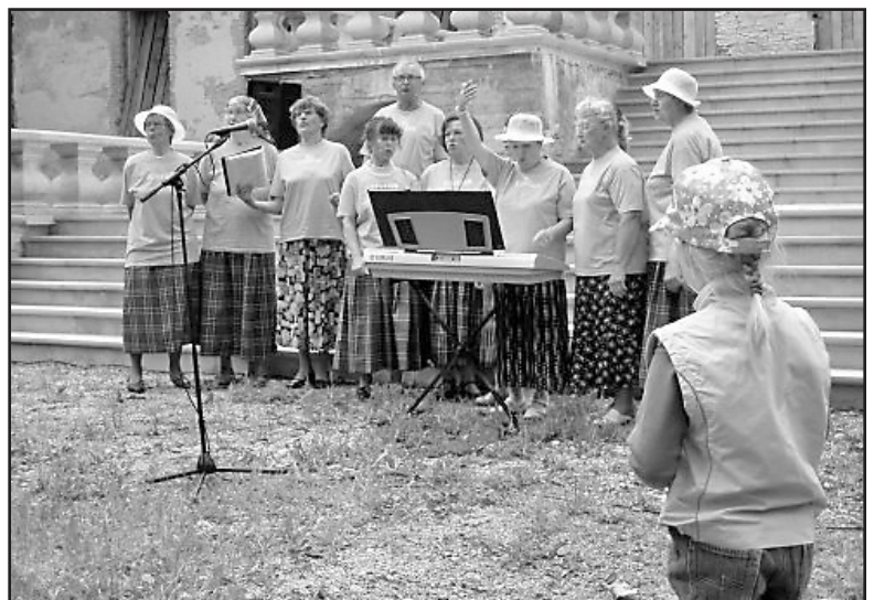
Esinevad ansamblid Rõõm Laulust ja Enelas. Suvepeo pilte saab vaadata http://picasaweb.google.com/lumemees1/PIDU

S u - v e p i d u k ä i b i k k a p i k n i k u - v o r m i s j a n i i e i p u u d u n u d k a s e e k o r d g r i l l - v o r s t i d . K ö l a s i d l ö b u s a d ü h i s - l a u l u d . V a h v a s e l t s k o n - n a t a n t s “ S e r j o ž a “ l ä k s l a u s a k o r d a m i - s e l e . M ä r k a m a t u l t o l i m ö ö d u n u d k o l m t u n d i l u s t i m i s t . K u i g i a a s t a d o n s e e n i o - r i d e j u u s t e s s e h u l g a h ö b e n i i t e p ö i m i n u d , o n n a d h i n g e l t n o o r e d .