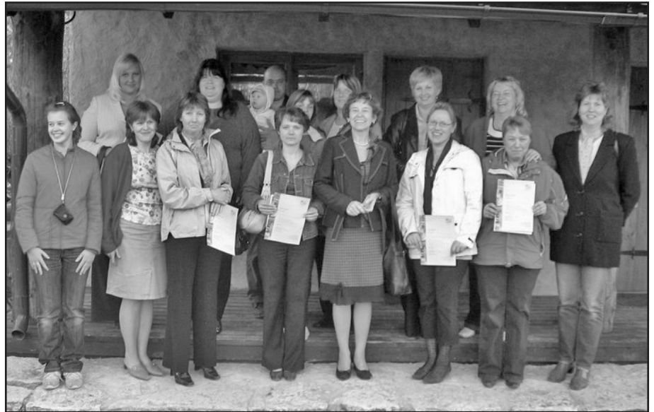
Koolitatud lapsevanemad oma kursuse lõpetamisel.

Toon ära mõned mõtted: olen hakanud paremaks kuulajaks, aega on tulnud juurde; ema- isa ei ütle vastuseid ette, kui on vaja otsustada; tajun ja tunnen ära vale käitumismalli; pereliikmed on märganud muutust; laps on muutunud avatumaks, räägib palju ja teeme koos; kuulan last tähelepanelikumalt, rahulik suhtlemine on tähtis.