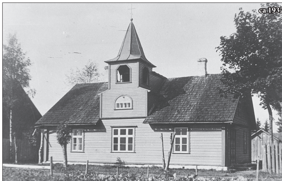
Eesti Vabariigi ajal ehitati maja ümber ja uue kellatorniga hoone oli juba päris kiriku väljanägemisega.