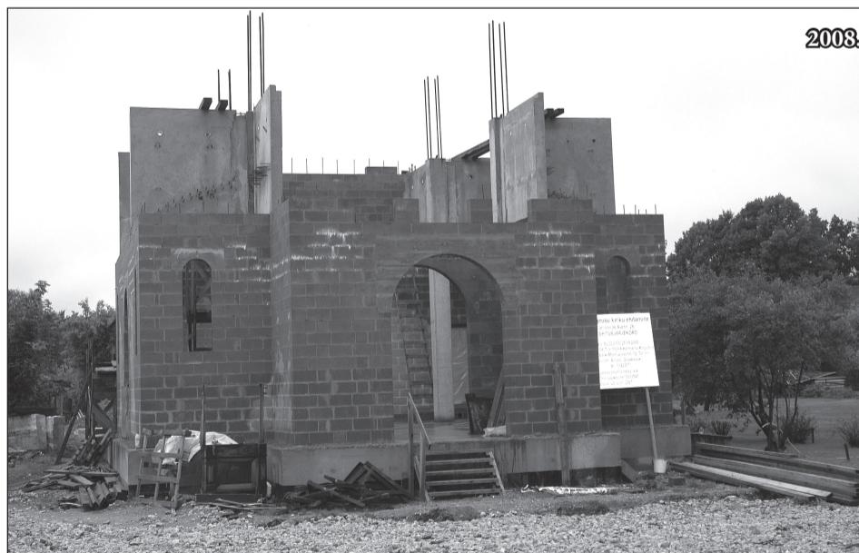
19. juulil 2007 pandi nurgakivi uuele klassikalises stiilis nelja sambaga ristkuppelhitisele, mis peaks mahutama ligi kaheksakümmend inimest. Vana kirik lammutati 26. juulil 2008. aastal.