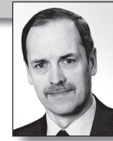
RENÉ VILJAT fotograaf