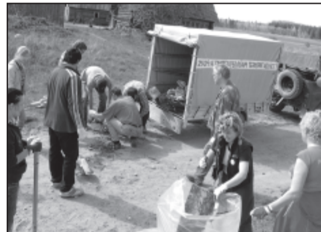
Rápina Rahvamaja segarahvatantsurühm tööhoos.