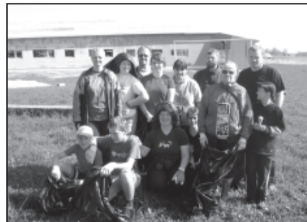
Prügikotid kätte jagatud - Linte meeskond koristuspäevaks valmis. Puhtaks said maanteeääred ja külaplats.