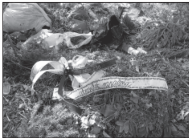
Pildil Ristipalo kalmistu prügimägi.