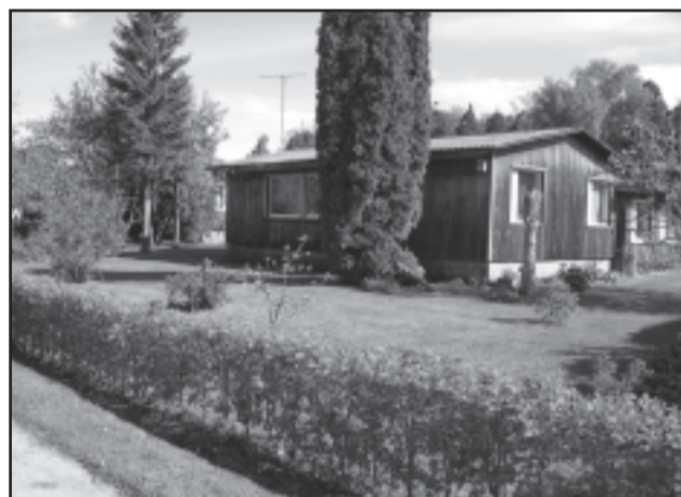
Perekond Palmaru koduaed.