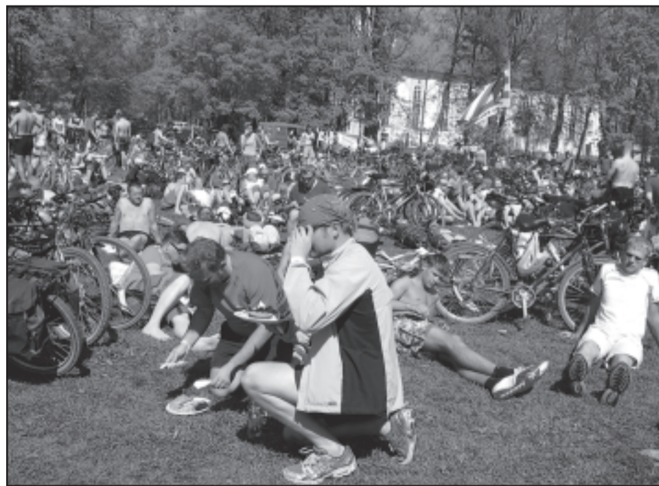
Hetk rattaretk lõpetamisest Rápina tuletõrje väljakul 11. mail.