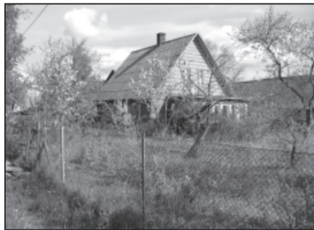
Hooletusse jäetud majaümbus.