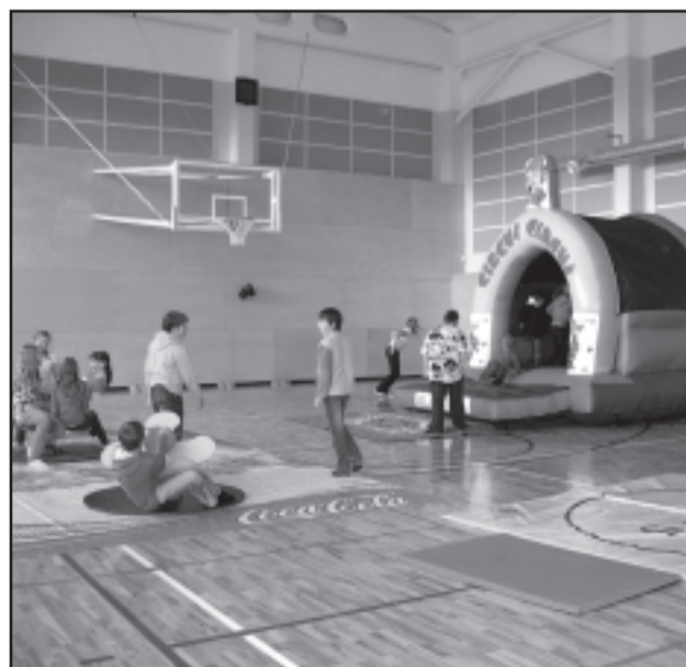
Pildil 6. klassi õpilased.