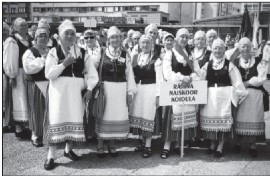
Naiskoor Koidula Soome-Eesti ühislaulupeol Soomes Pori linnas