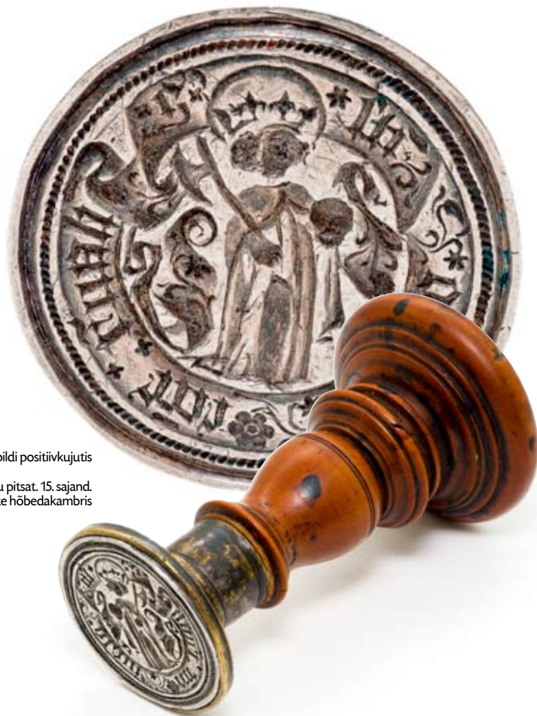
Pitsatipildi positiivkujutis Oleviste kiriku pitsat. 15. sajand. Eksponeeritud Niguliste hõbedakambris

Sügisel 2007 lisandus Niguliste hõbedakambri aarete sekka veel üks haruldus – Oleviste kiriku keskaegne pitsat. Ehkki mõõdetult tibatilluke (hõbedast pitsatipildi läbimõõt 4,4 cm), väärib ese esiletõstmist just oma vanuse ja harukordsuse tõttu. Nimelt on keskaegseid pitsereid – olgu need siis üksikisikute või institutsioonide omad – Eestis säilinud küll sadu, ent pitsateid, millega neid löödi, vaid mõni üksik. Selles pole ka midagi imeilku, sest üksikisiku pitsati kasutamine piirdus tema eluajaga ning pärast surma ese hävitati; keskajast 19.–20. sajandi ni tegutsenud institutsioonide arv aga oli väike, pealegi võidi aja jooksul kasutusele võtta uusi templeid.