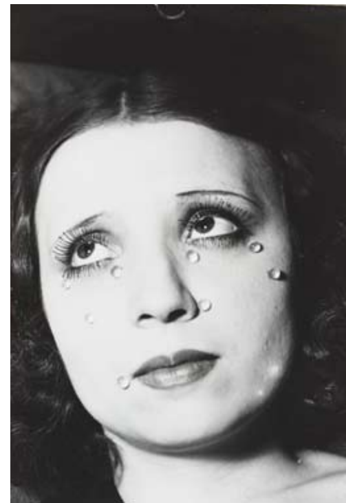
Man Ray (1890–1976). Klaasipisarad. 1932. Hõbe-želatiini tömmis. Centre Pompidou