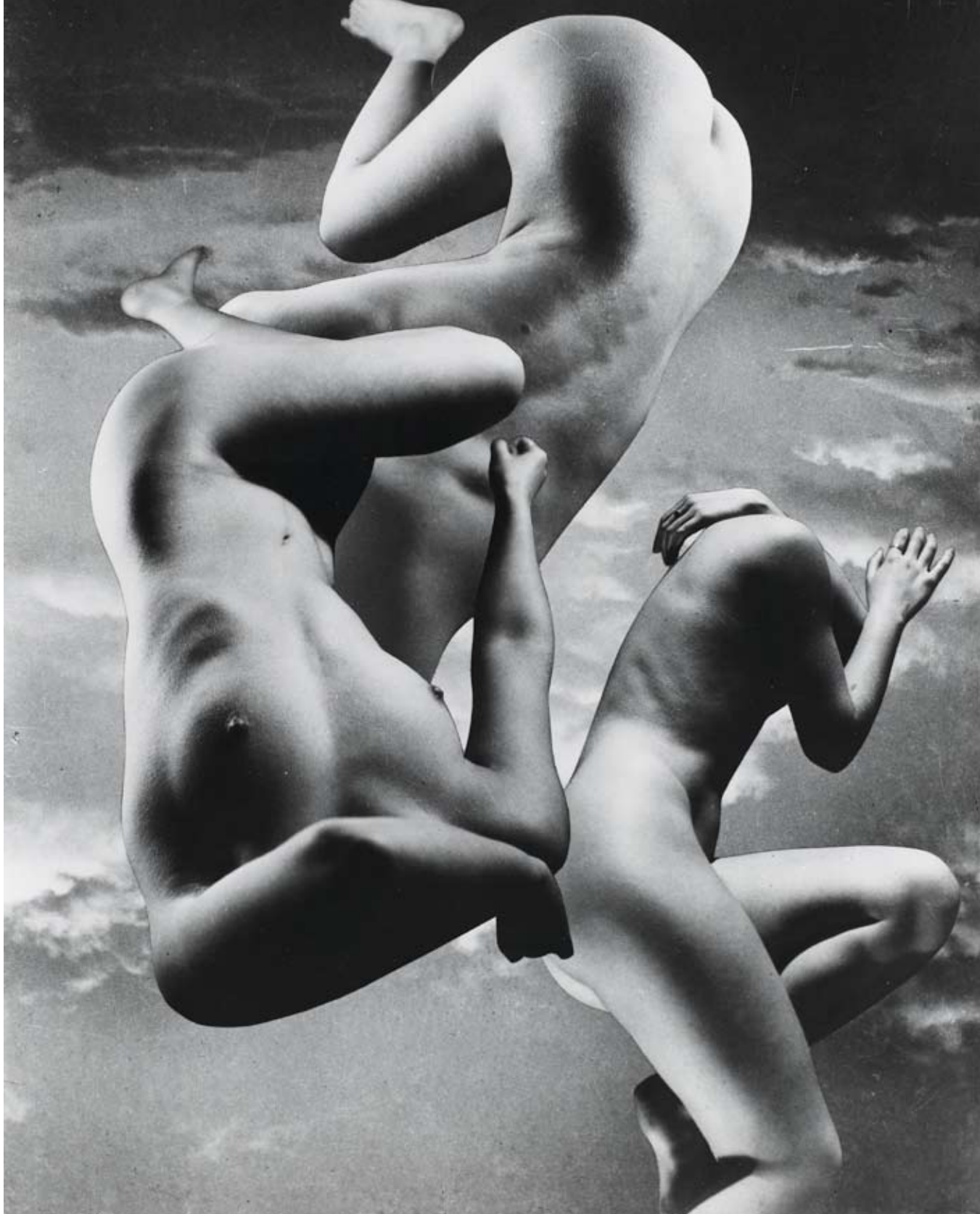
Pierre Boucher (1908–2000). Langevad kehad. 1936. Fotomontaaž, hõbe-želatiini tömmis. Centre Pompidou