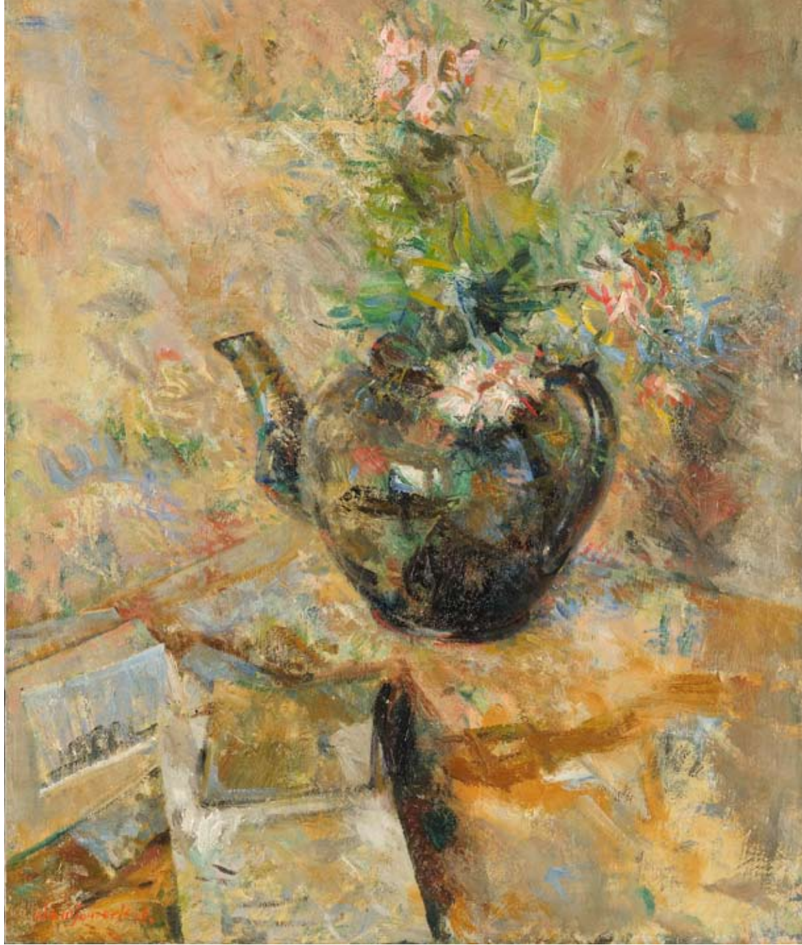
Adamson-Eric. Nelgid teekannus. 1935. Õli. EKM