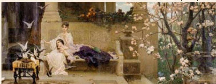
W. Kotarbinski. Kevad. 19. sajandi II pool. Õli