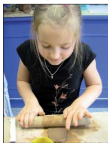
Esimene nädal lõppes

viltisime kaelakee. Tüdrukutel valmisid tekstiilimaalis seelikud, poistel kaelarätid. Õppisime selgeks akrüülvärvidega maalimise ja monotüüpi tehnikat.