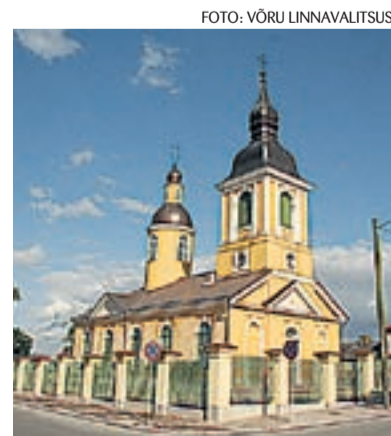
Võru Jekaterina kirik.