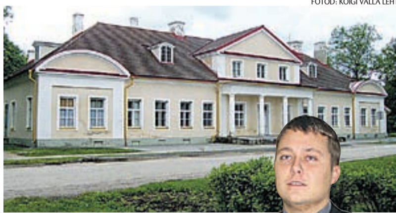
Koigi mõisa ei pea enam puudega kütma.

Septembrikuus algasid endises mõisahoones ka Euroopa Liidu poolt toetatavad renoveerimistööd, mille käigus saab Koigi mõisa peahoone nii uue sisu kui ka värskenatunud välimuse. Remonditööd lähevad eelduslikult kokku maksma peaaegu 18 miljonit krooni. Sellest üle 15 miljoni krooni tuleb Euroopa Liidu abipro-