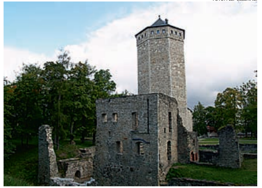
Paide vallitorn ootab külastajaid.

REFORMIERAKOND Tõnismägi 9 10119 TALLINN