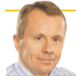
Jürgen Ligi, Riigikogu rahanduskomisjoni esimees