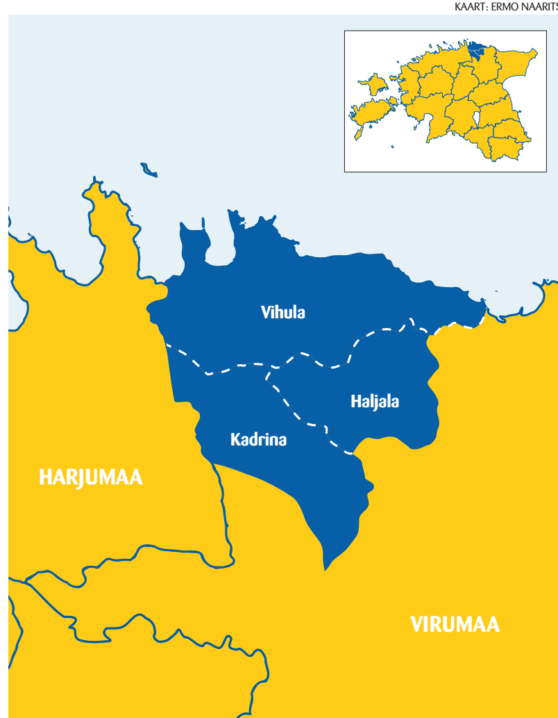
Kolm valda moodustaksid koos võimeka suurvalda.

Omavalitsuste liitumisel sünniks enam kui 10 000 elanikuga ja ligi 150 miljoni kroonise eelarvega suurvald põhjarannikul. „Kujuneb suurem eelarve, sellega koos suurem võimekus