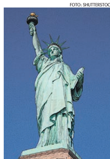
Nüüdsest saavad Eesti kodanikud vabalt vabaduse sümbolit – New Yorgi vabadussammast – külastada.