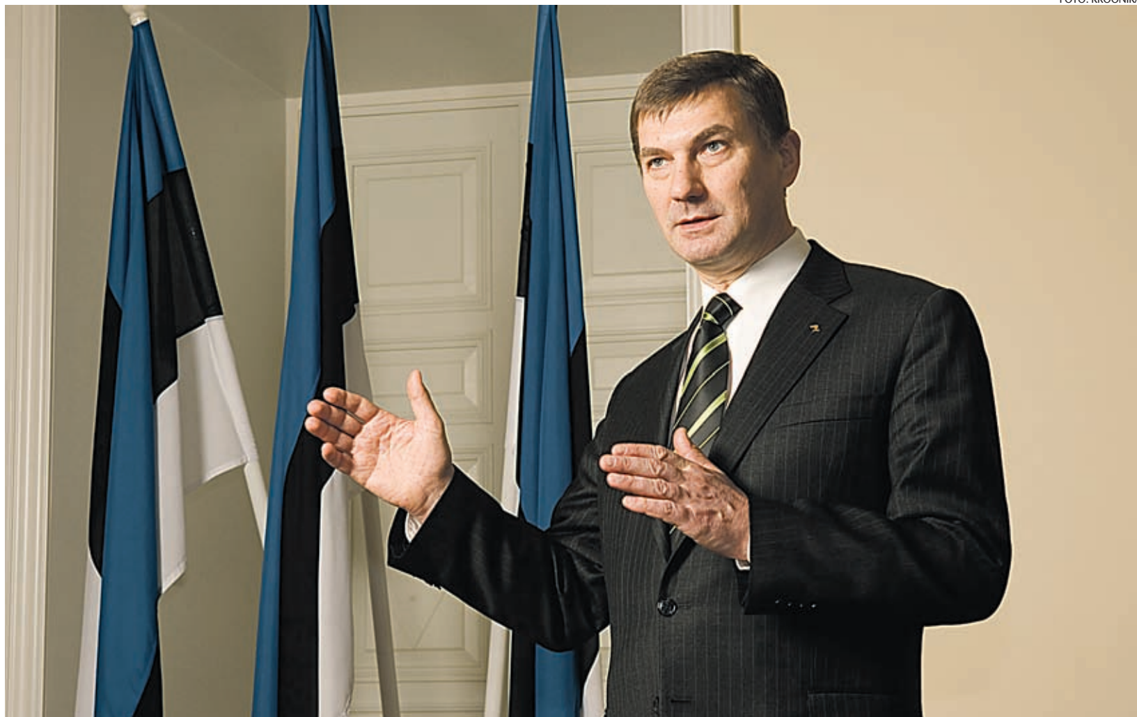
Peaminister Andrus Ansip hinnangul on Eesti kõige olulisem lähituleviku eesmärk ühinemine euroalaga.