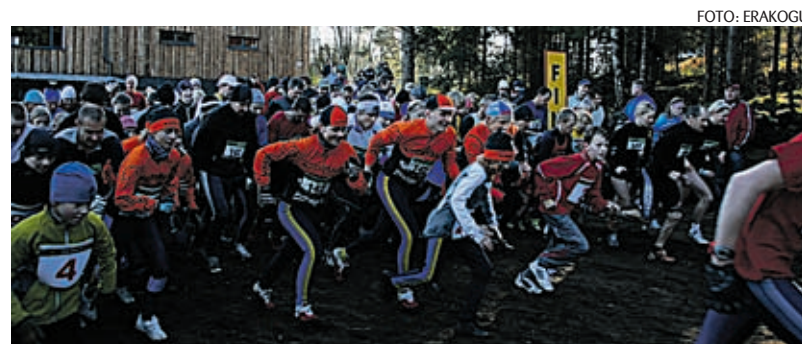
Ebavere Tervisesportikeskus avati jooksuvõistlusega.

Tema sõnul on konkreetseid prognoose spordikeskuse kasutatavuse