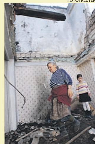
Grusiinide sõjast laastatud kodud tuleb taas üles ehitada.