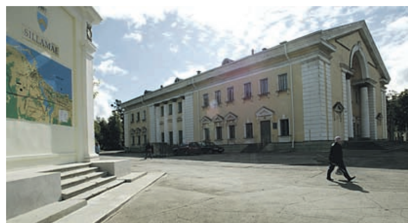
Sillamäe eelarve hoolib linlastest.

Sel viisil loodi varu tuleviku tarbeks. Täna on tingimustes ei saa investimisprojekte piisavas mahus finantseerida. Kuid tihti sõltub just linnaelanikest linna heakorras kulutatavate vahendite suurus. Näiteks arutati rahanduskomisjoni koosole-