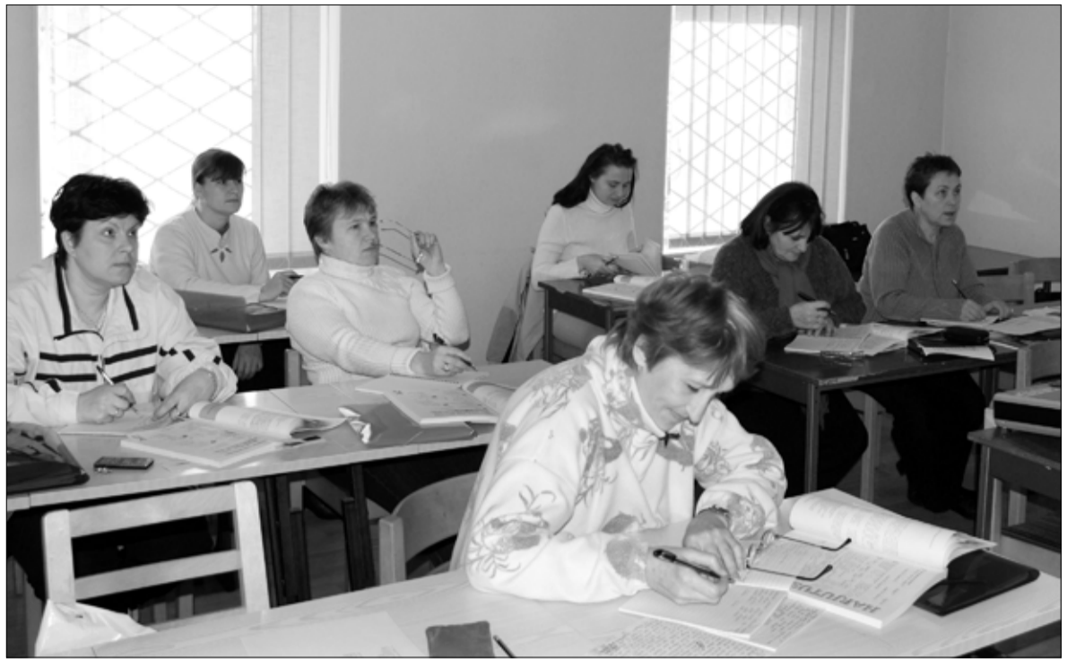
В Арендускода постоянно находят новые возможности для обучения государственному языку.