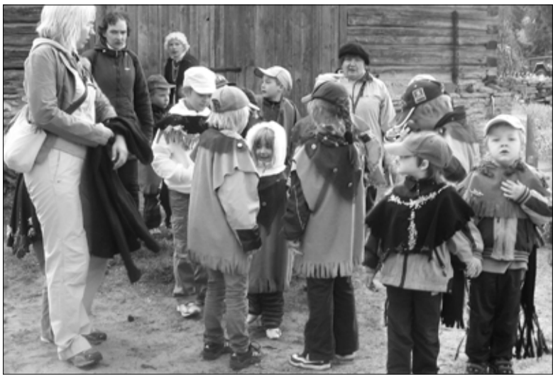
Päikesejätkud Vösul Mamsitoas.