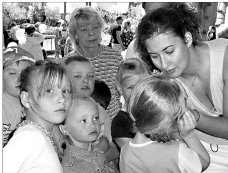
Lastekaitsepäeval soovisid paljud end kaunistada näomaalingutega.

Tapa vallavalitsus ja MTÜ Tapa LKÜ tänavad sponsoreid ja tublisid abilisi, kes aitasid igati kaasa sellele, et Tapa valla lapsed said nautida päikesepaistelist las-