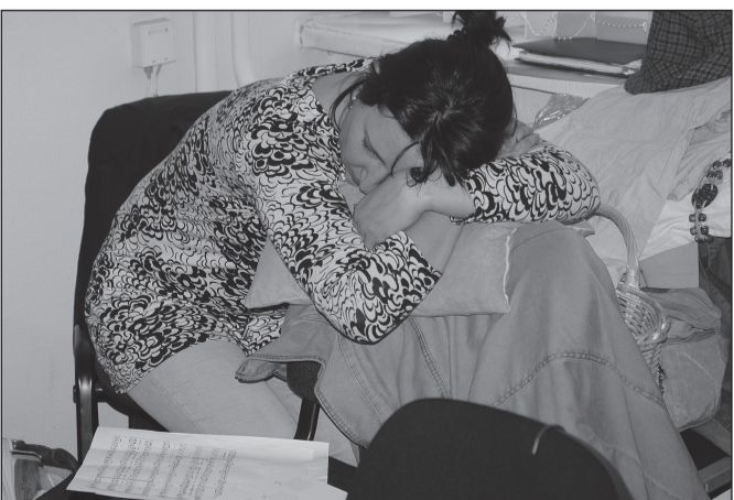
Ave teab, et lahingu eel tuleb ennast korralikult välja puhata. Siis jätkub ka võitlustahet rohkem.