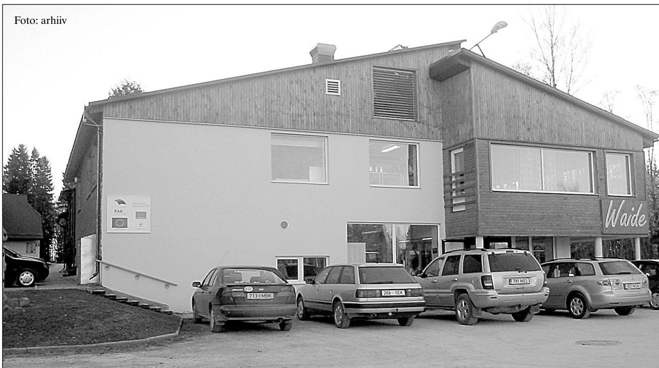
Waide motellist on tänaseks päevaks kujunenud tunnustatud turismiettevõtte.