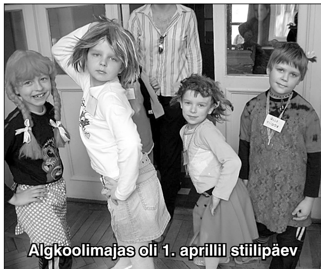
Algkoolimajas oli 1. aprillil stiilpäev

Konnainfo telefon 5190 0903 on avatud konnade rände ajal 1. aprillist 31. maini ja 1. septembrist 20. oktoobrini. Looduskaitsekeskus analüüsib infotelefonile tulnud andmeid ning edastab need maanteeametile, et teeremonti tehes saaks planeerida konnatunnelite rajamist. BNS