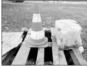
Kümneaastane poiss pääses suuremast õnnetusest ehmatusega. Lk 3