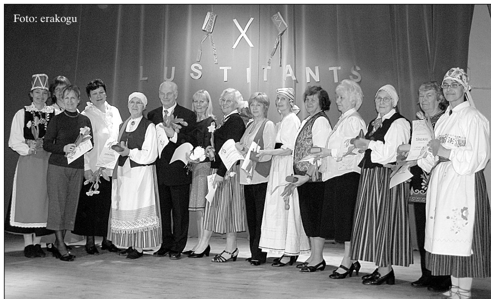
Laval on tantsurühmade juhendajad.