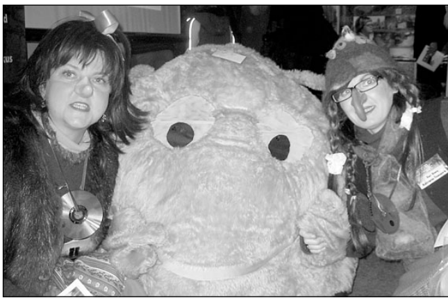
Kratid Kratikülalt ja Vapu.

Elva puhkepiirkonda esindasid Elva linnavalitsus, Waide Motell, Hellenurme vesiveski, VVV SA, Võrtsjärve piirkond, Rõngu vald, Luke mõisapark ja Tartumaa tervisespordikeskus. Mess andis mõtteainet järgmise aasta ettevalmistamiseks ja kinnitades fakti, et paljud Elva puhkepiirkonda ei tunne ning teised, kes piirkonnaga kursis olid, lootsid leida uusi ja huvitavaid tegevusi. Üldiselt loeti messi kordaläinuks. Jäeb vaid oodata rohkeid külastajaid Elva puhkepiirkonda.