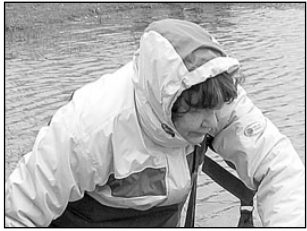
Lasteaednikud harisid end loodusteadlikuks. Lk 2