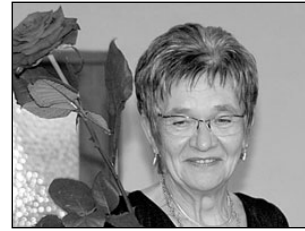
Dirigent pidas juubelit koos noorte meestega. Lk 5