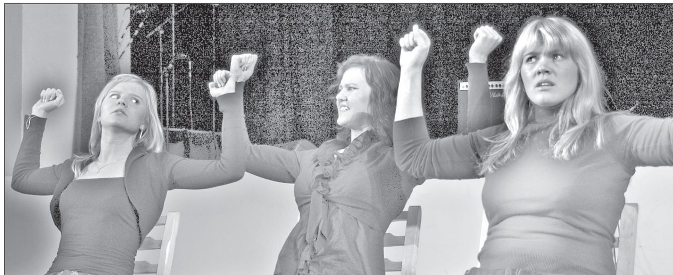
TORIMI KAUPÕ PILT