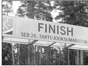
Tervisespordikeskuses arutati sihtasutuse tegevusplaane. Lk 3