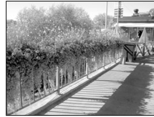
Ka Elva tänavapildis võiks olla rohkem lilli. Lk 5